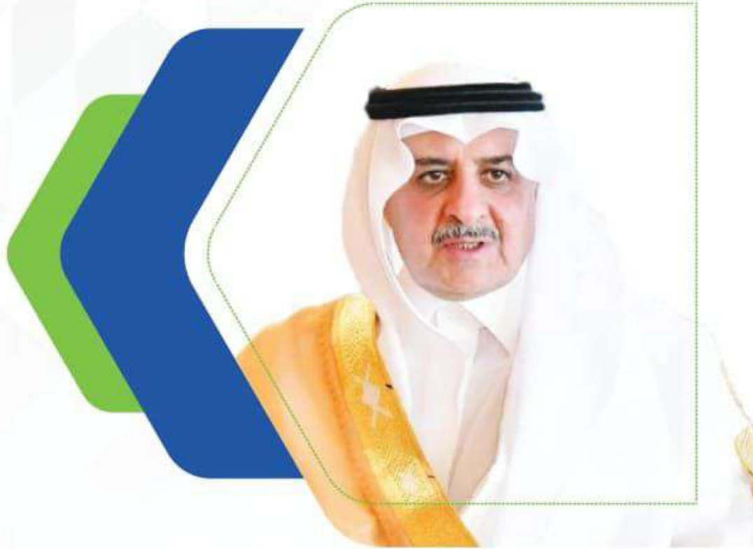
(صاحب السمو الملكي الأمير) فهد بن سلطان بن عبدالعزيز ال سعود أمير منطقة تبوك