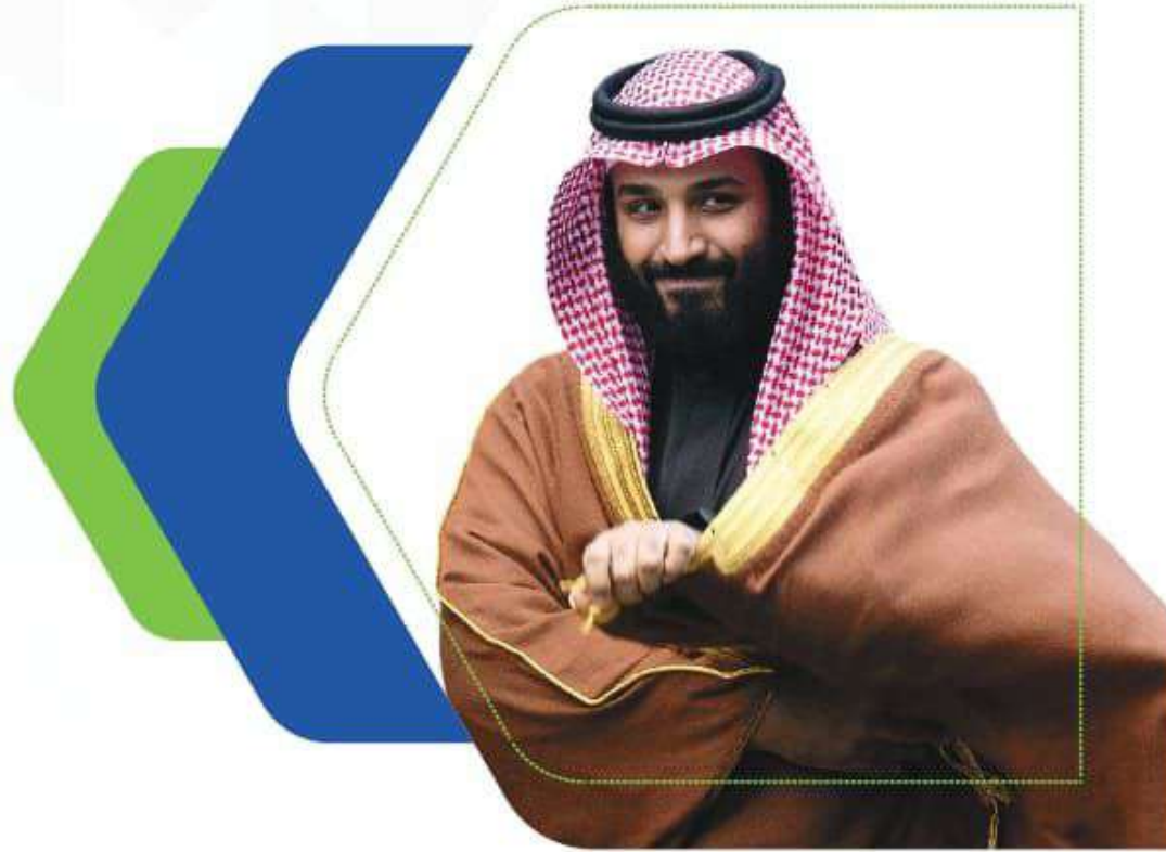
(صاحب السمو الملكي الأمير) محمد بن سلمان بن عبدالعزيز آل سعود ولي العهد نائب رئيس مجلس الوزراء وزير الدفاع