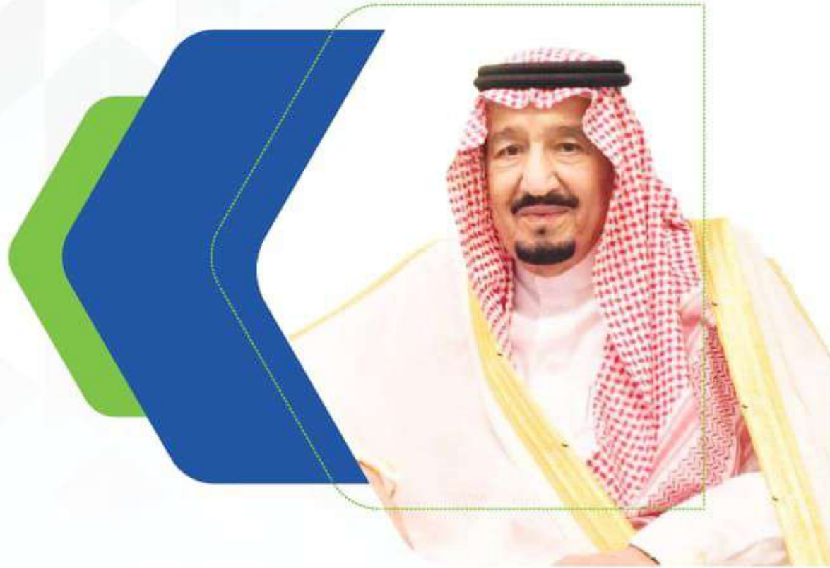
(خادم الحرمين الشريفين) الملك سلمان بن عبدالعزيز آل سعود حفظه الله